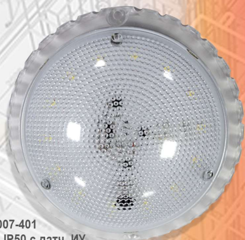
"ЖКХ-LED" Спецсвет 03-007-401 (ф133, 7Вт, 840Лм, 6500К) IP50 с датч. ИУ Светильник светодиодный Элетех 1030450337